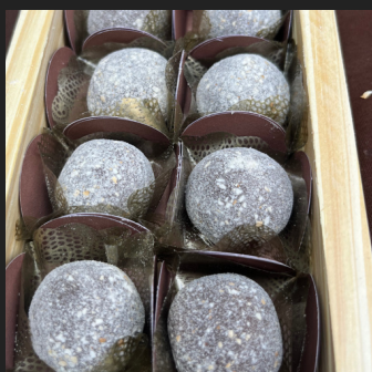
BRIGADEIRO AO LEITE NA FAROFA DE MATZAH