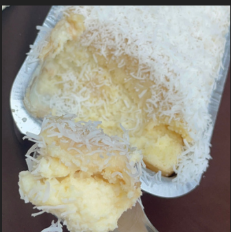
BOLO DE COCO GELADO COM BEIJINHO