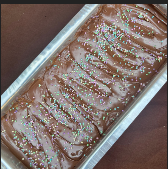
BROWNIE COM NUTELLA