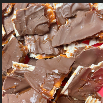
SNACK DE MATZA: CAMELO COM FLOR DE SAL E CHOCOLATE