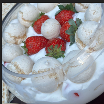
MERENGUE DE MORANGO