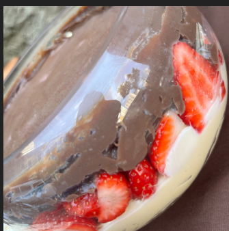
BOMBOM DE MORANGO