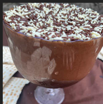
MOUSSE DE CHOCOLATE COM BASE DE BRIGADEIRO